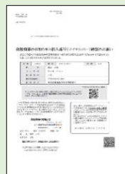
【資格情報のお知らせ】