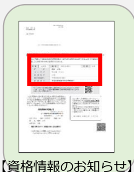
【資格情報のお知らせ】