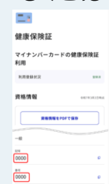
【マイナポータル画面】