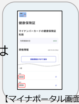
【マイナポータル画面】