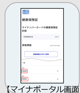
【マイナポータル画面】

※医療機関/健診センターによっては、マイナ保険証読み取り機の設置が無い場合がございます。 マイナ保険証のみでなく、必ず資格情報のお知らせをご持参ください。